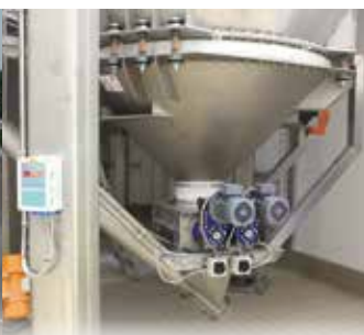
Sistema di pesatura e sicurezza intrinseca al carico