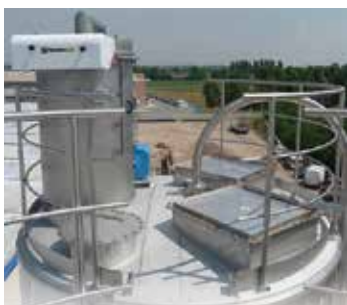
Filtrazione aria di carico e protezione ATEX