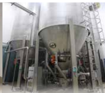
Sistema di deumidificazione e isolamento a doppia parete