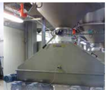
Estrazione FIFO singola o multipla