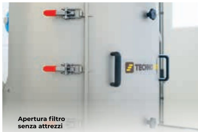
Apertura filtro senza attrezzi