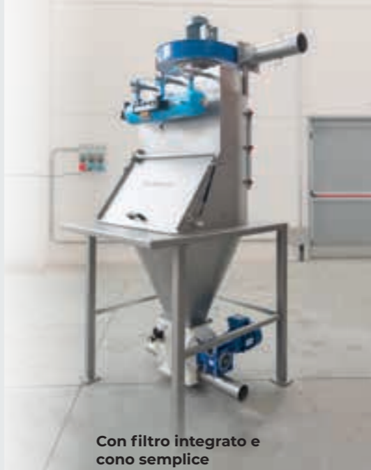
Con filtro integrato e cono semplice