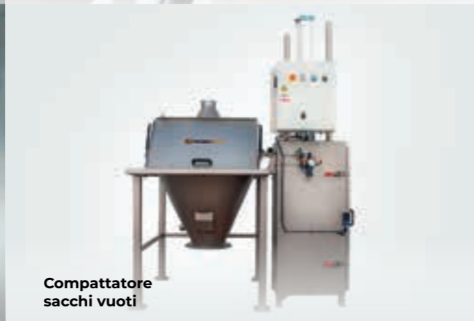
Compattatore sacchi vuoti