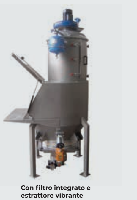
Con filtro integrato e estrattore vibrante