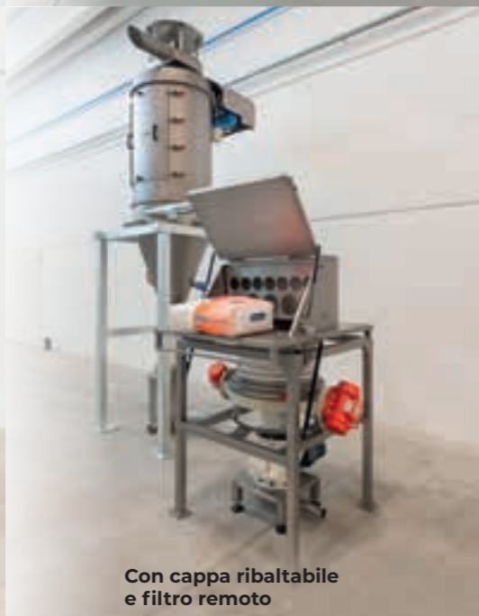
Con cappa ribaltabile e filtro remoto