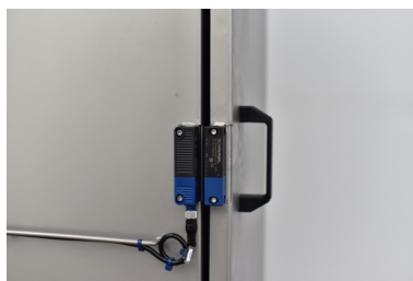
Porta con sensore di apertura Interlocked main door