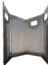
Contenitore asportabile e apribile Openable and removable waste bin