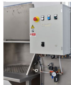
Con quadro di comando With integrated control Switchboard

TECHNOSILOS progetta e costruisce impianti di stoccaggio, trasporto, dosaggio di prodotti in polvere, granulari e liquidi, completi di sistemi di supervisione e automazione