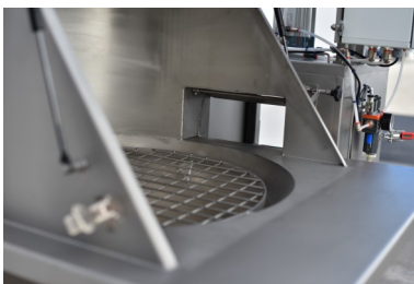
Portella con sensore di apertura Interlocked access door