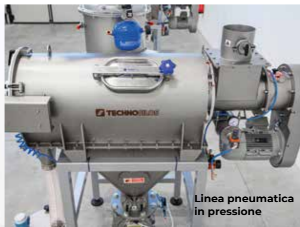
Linea pneumatica in pressione