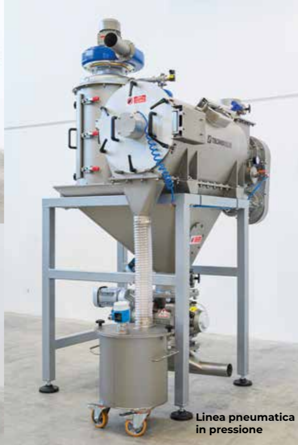
Linea pneumatica in pressione