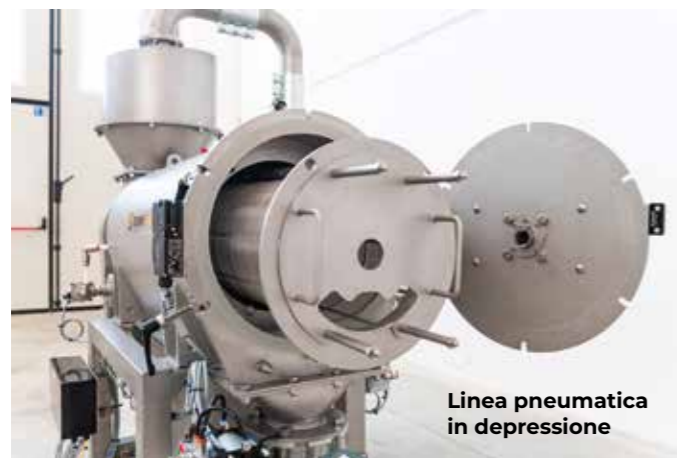
Linea pneumatica in depressione