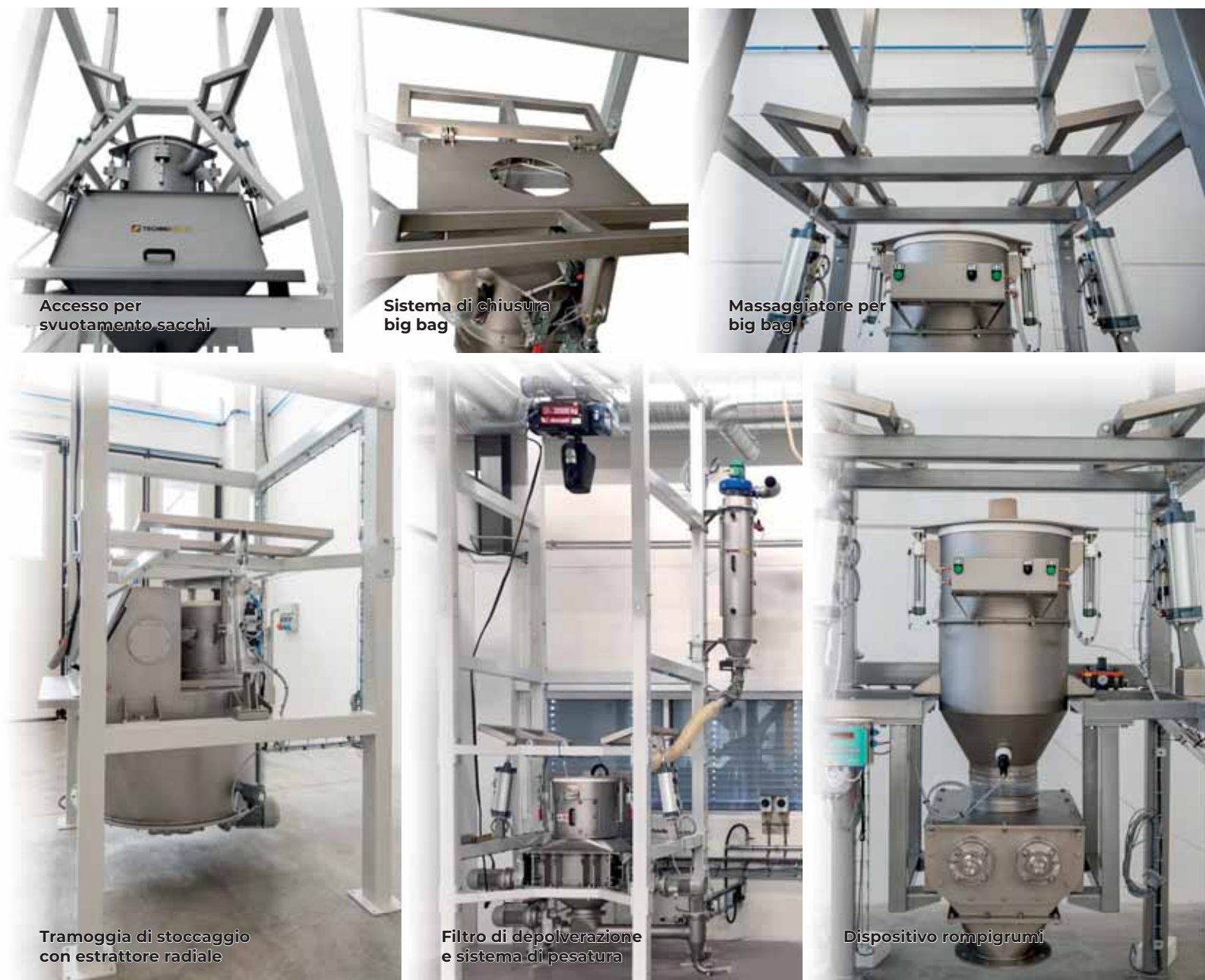
Accesso per svuotamento sacchi