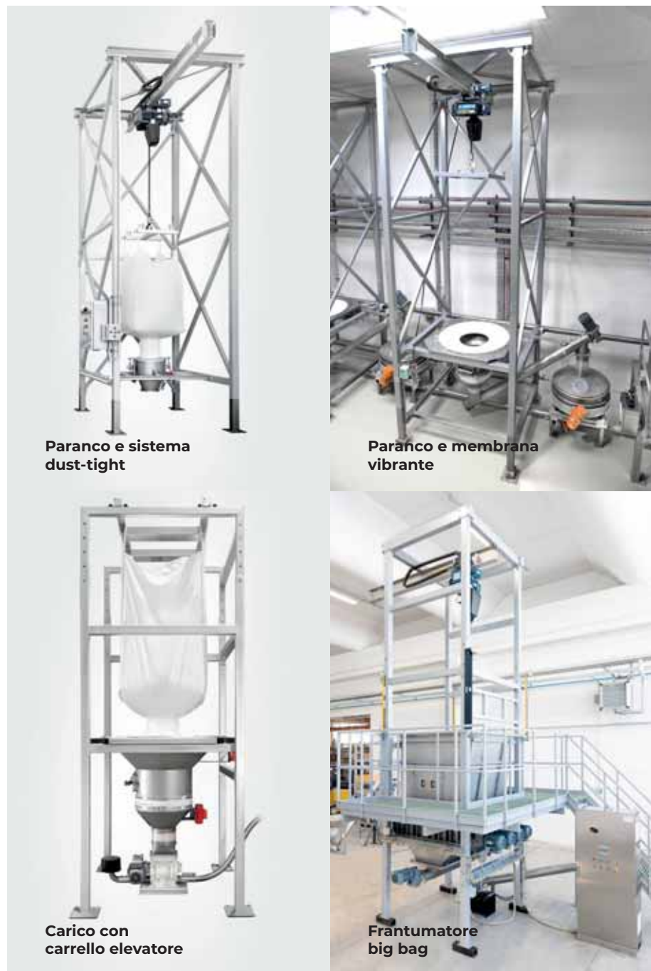
Paranco e sistema dust-tight