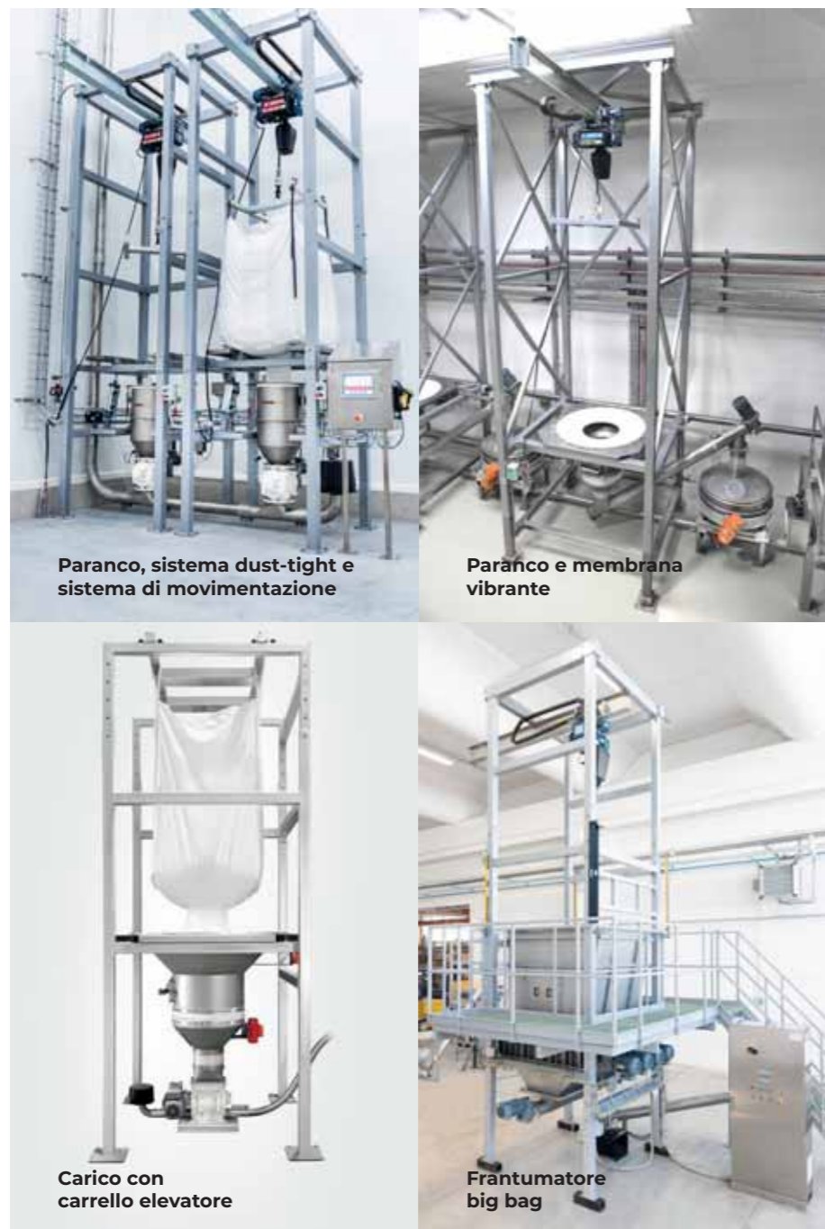
Paranco, sistema dust-tight e sistema di movimentazione